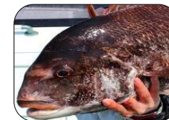
【婚姻色の雄マダイ】

3月の中部地方の沖釣りターゲットは、 マダイ・アジ・アカムツ・ヒラメ・オニカサゴ & ヤリイカ になります。