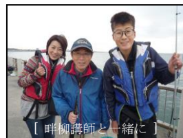
[畔柳講師と一緒に]