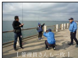
[管理員さんも一枚]