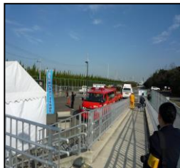
[パトカー・消防車]