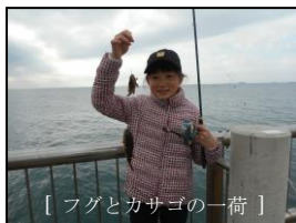
[フグとカサゴの一荷]