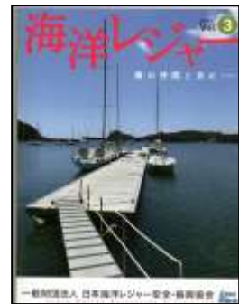
[ 海洋レジャーVol3 表紙 ]

(一社)日本海洋レジャー安全・振興協会から、機関誌“海洋レジャー”が、送られてきました。「持続可能な発展を目指して」の佐久間理事長の挨拶から始まり、コラムあり、活動報告ありと、号を重ねるごとに、読み応えのある冊子に仕上がっております。