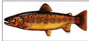
ブラウントラウト