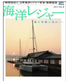
[『海洋レジャー』表紙]

一般財団法人 日本海洋レジャー安全振興協会様から『海洋レジャー2017vo2』が、JOFI 東海事務局に送られてきました。内容は「年頭の挨拶」から始まり、「特集 海洋レジャーボートینگ」「各事業部からの活動報告」などと続き、大変読み応えのある編集がされていました。