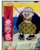
〔ノンキナトウサン 漫画〕