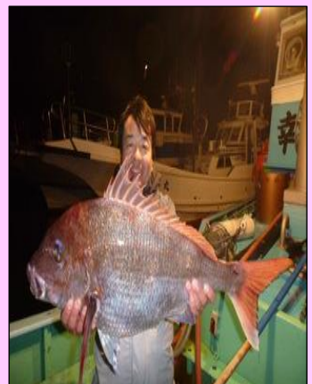
[ こちらは80cmのマダイ ]