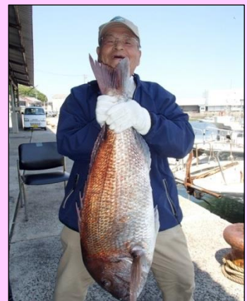
[ 帰港後、97cmのマダイを手に ]

< 情報提供：久六釣船(師崎港 TEL 0569-63-1859) 幸徳丸 (石鏡港 TEL 0599-53-2371) >